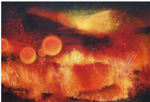
早川 剛「untitled」 192.0 x 130.0 cm 杉板に日本画岩絵具、樹脂 2005年 ※映画「同じ月を見ている」登場作品