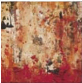
早川 剛「湧き上がる大地」 27.3 x 27.3 cm 水彩紙、日本画岩絵具、東膠 2007年